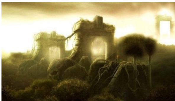
Il existe une 3ème porte qui n'est pas duelle.

Nous savons clairement aussi que cette stratégie de diversion est intentionnellement appliquée afin de pousser la psyché de l'individu à la colère et à la rébellion. De même, si internet peut être un puissant outil d'information et de communication au service de l'évolution humaine, il est aussi un puissant moyen de pouvoir et de contrôle au service de l'élite. Ainsi, les réseaux sociaux participent à entretenir la propagande dualiste et uniquement dualiste, en manipulant l'individu à travers son émotionnel et en implantant dans son inconscient des informations subliminales l'éveillant à ses bas instincts et à ses pulsions de colère, de haine, de ségrégation, en l'obligeant insidieusement à prendre un parti quelconque... Ces réseaux font donc office de remarquables indicateurs du niveau de conscience de la société, mais jamais ne contribuent à dévoiler L'EXISTENCE D'UNE TROISIÈME ALTERNATIVE.