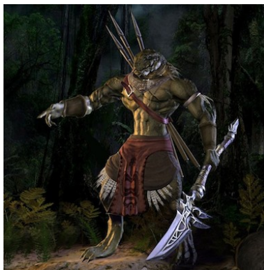
Personnage ressemblant à un Être reptilien guerrier

C'est cette même partie primaire de l'encéphale qui est responsable de la "malléabilité" du champ magnétique de l'ego. Elle intègre des caractéristiques spécifiques de "l'héritage fonctionnel", que vous ont laissées certaines lignées de vos créateurs. C'est d'ailleurs à travers l'évolution de l'âme, que ce "patrimoine fonctionnel" est devenu, d'incarnation en incarnation, votre émotionnel d'aujourd'hui induisant vos comportements.