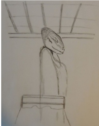
Croquis de l'Être Amasutum qui s'est matérialisé dans la chambre de Jenaël

Ce chemin d'accomplissement s'est réalisé essentiellement à partir de la génétique de l'Homo sapiens d'antan, qui a évolué en mutant progressivement sa génétique reptilienne, pour devenir l'humanité contemporaine. Ce cheminement que l'humain a appelé avec raison "le chemin christique", a induit une évolution quasi artificielle de "l'âme groupe humaine". Ce qui a permis à certaines lignées reptiliennes, exagérément prédatrices, de "rééquilibrer plus rapidement" leurs schémas de dualité extrêmes, en devenant progressivement à travers l'évolution de l'homme, de moins en moins agressives.