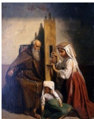
Le Confessionnal Peinture Edouard Cibot

enlise la personne dans ses propres schémas de dualité. En conséquence, elle entretient un perpétuel sentiment d'injustice et de culpabilité, pouvant la mener jusqu'à une profonde dépression.